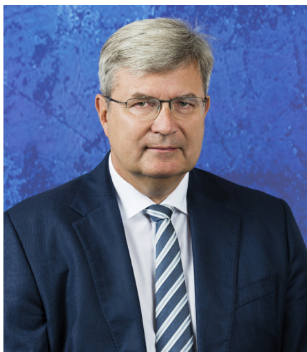
Miroslav Jansta předseda České unie sportu

Do prvního roku nového století českého sportu - roku 2019 - přeji Vám všem mnoho sportovních úspěchů, osobního štěstí, nezbytného zdraví a těm nejlepším z Vás také vydařené kroky v úsilí o nominaci na Letní olympijské hry 2020 v Tokiu.