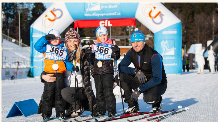
V lednu odstartoval seriál lyžařských běhů ČUS Stopa pro život.

Zpravodaj ČUS vydává Výkonný výbor České unie sportu - www.cusczech.cz . Adresa redakce: Zátokova 100/2, 160 17 Praha 6, tel. 233017345. Distribuováno zdarma v elektronické podobě. Uzávěrka vydání: 30. ledna 2019. Za správnost a věcný obsah textů ručí jednotliví autoři. Zkratky: Komunikační tým ČUS = KT ČUS. ISSN 1212-1061