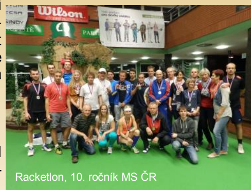
Racketlon, 10. ročník MS ČR