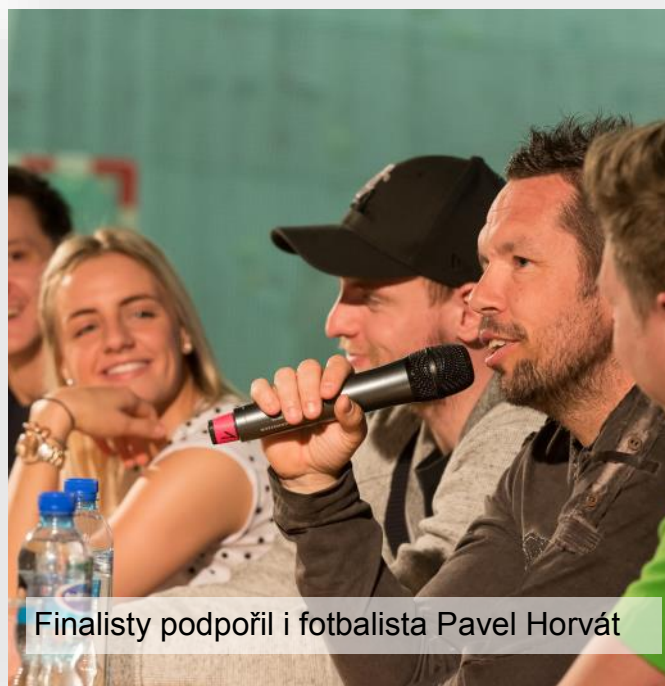
Finalisty podpořil i fotbalista Pavel Horvát

Jenže dívčí finále mělo tentokrát diametrálně odlišný průběh. Havlíčkův Brod své vítězné tažení v rozhodujícím duelu nedotáhl. Loňské vítězky ze Zlína se totiž už podruhé nenechaly zaskočit jako v základní skupině. Výborně bránily a své akce navíc úspěšně zakončovaly. Ještě v prvním poločase se hráčky z Vysočiny držely, ale pak se jim přestalo dařit a výsledkem byl vysoký rozdíl ve skóre 21:11.